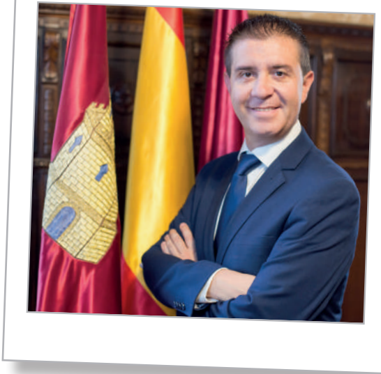
Santiago Cabañero Masip

Estimados Casasdevesanos: mi gratitud hacia vuestro ayuntamiento y alcalde por la invitación para poder compartir con todos vosotros desde vuestro programa de fiestas mis mejores deseos con motivo de la celebración de las fiestas locales en honor a la Virgen de la Encarnación, advocación mariana a la que Casas de Ves está acogida con fervor y tradición centenaria.